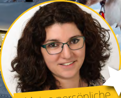
Meine persönliche Empfehlung

KUNDENABEND 27.09.18, 18:30 Uhr | Verlagshaus Fränkischer Tag, Gutenbergstr. 1, 96050 Bamberg