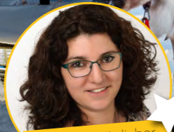
Mein persönlicher Tipp

5 Tage 4-Sterne Hotel Frühstück 1.169,- pro Person ab