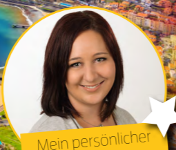
Mein persönlicher Tipp

8 Tage 4-Sterne Hotel Halbpension 1.179,- pro Person ab