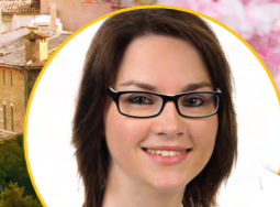
Mein persönlicher Tipp