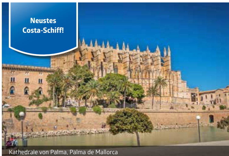
Kathedrale von Palma, Palma de Mallorca