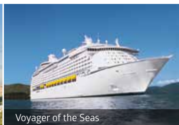
Voyager of the Seas