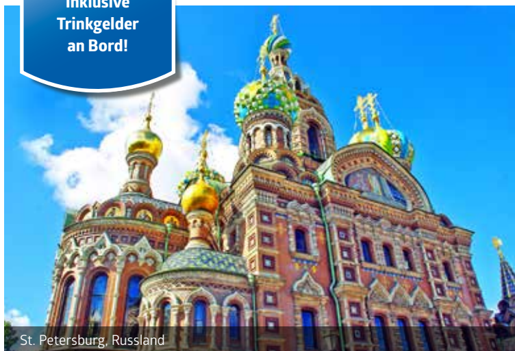
St. Petersburg, Russland